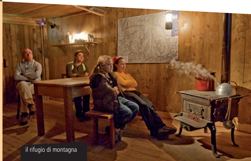
il rifugio di montagna

Alla torretta si giunge attraverso un tunnel al cui interno si snoda un percorso di visita che presenta il lupo dal punto di vista naturalistico. Insieme al recinto e al tunnel in località Casermette , posizionati presso la sede operativa del Parco delle Alpi Marittime, il Centro faunistico Uomini e Lupi comprende un secondo spazio espositivo nel paese di Entracque , dedicato al rapporto uomo-lupo.