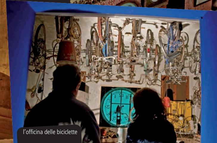
l'officina delle biciclette