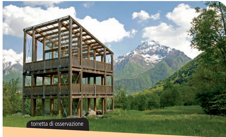
torretta di osservazione

Dal contatto con tutti questi personaggi emerge una morale solo in apparenza scontata: il lupo non è né buono né cattivo, il lupo attacca altri animali perché così vuole il suo istinto, perché quella è la parte che gli è stata assegnata nella grande rappresentazione del ciclo della vita.