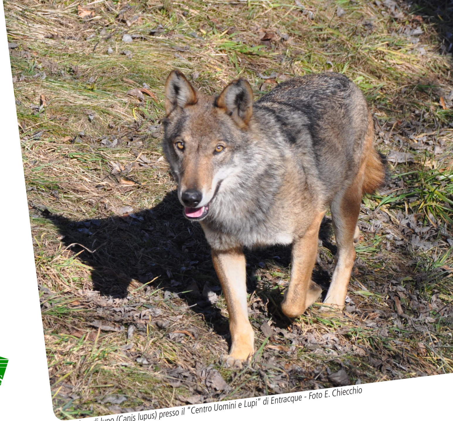
Esemplare di lupo ( Canis lupus ) presso il "Centro Uomini e Lupi" di Entracque